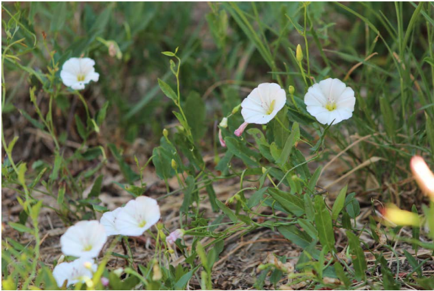
Liseron en fleurs

Le liseron est une liane qui grimpe sur les légumes et les tire au sol , vous pouvez la désherber sur les zones de culture.