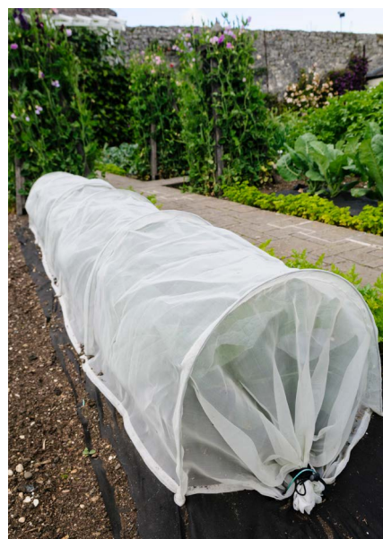
Exemple de voile sur une planche de culture

En "derniers recours", vous pouvez aussi installer des voiles pour protéger les Brassicacées menacées .