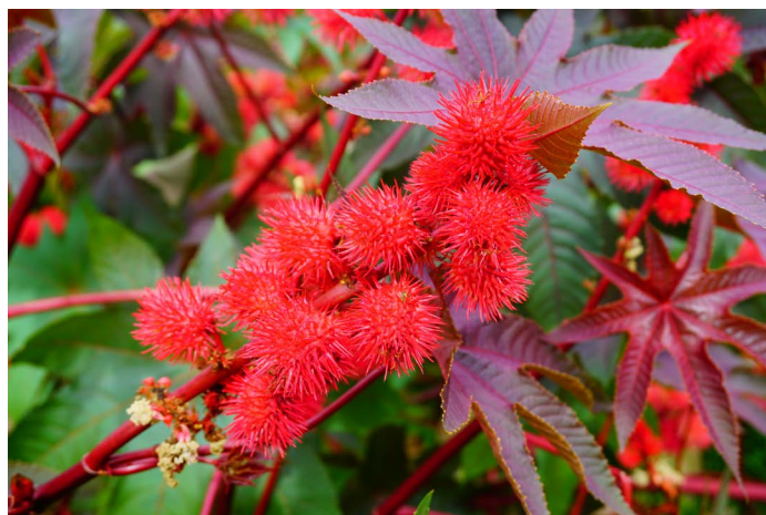
Ricin ( Ricinus communis )

Les populations de rongeurs ont tendance à se réguler d'elles-mêmes d'une année sur l'autre, lorsqu'elles n'ont plus suffisamment à manger ou que leur présence attire des prédateurs.